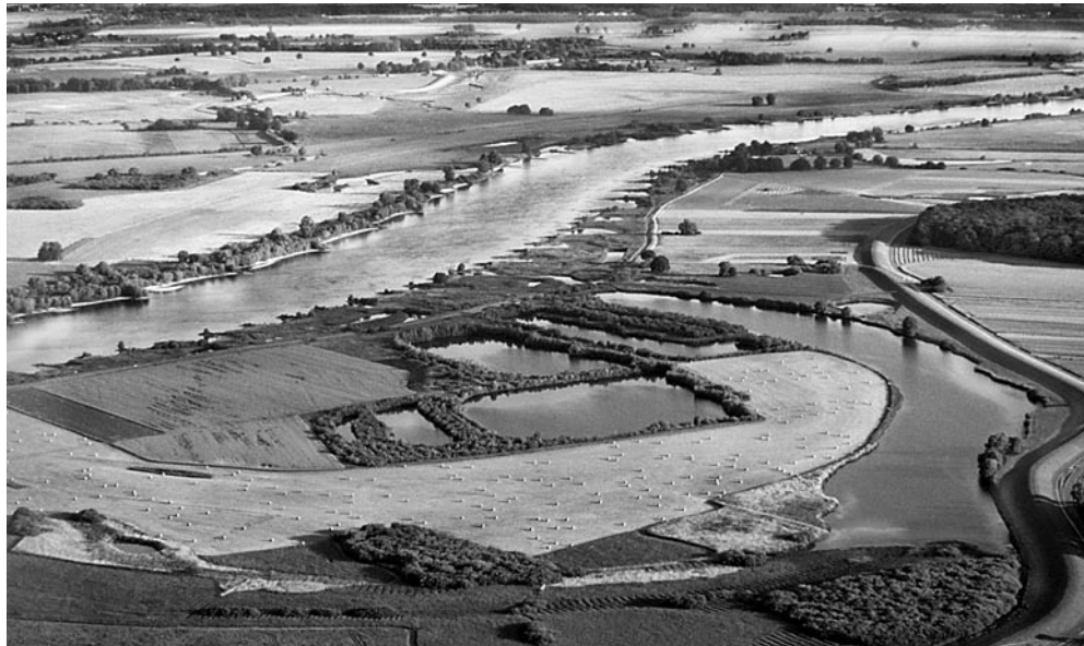
Elbregion bei Bleckede, Niedersachsen.

Der Stiefbruder Ottos II., Graf Heinrich von Gardelegen, mit der Grafschaft Arneburg westelbisch ausgestattet, strebte danach, aus seinem Besitz ein unabhängiges Bistum zu machen. Einvernehmlich mit seinem Bruder Otto II. setzte er dieses Ansinnen in die Tat um. Zunächst stand Tangermünde im Vordergrund des Bemühens, bald aber galt Stendal als der ausgesuchte Ort für die Umsetzung. Am 29. Mai 1188 wurde zum eigenen Seelenheil und das der Familie im Süden der Stadt ein Chorherrenstift durch Papst Clemens III. urkundlich bestätigt. Nicht weit davon entfernt wurde die Pfarrei dem Hl. Jacobus im 12. Jh. geweihte Kirche errichtet, in der seither Pilger und Kaufleute Schutz für ihre Unternehmungen erbaten. Erst im 14. Jh. wird auf das Hospital St. Gertrud aufmerksam gemacht. Es wurde von dem Arzt Sweder und dem Patrizier Nikolaus von Bismarck zur Versorgung der Pilger gegründet.